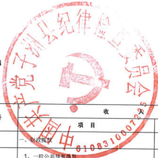
2021年部门综合预算财政拨款收支总表