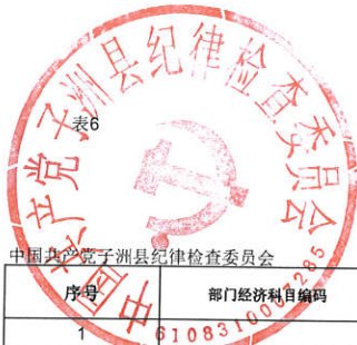
2021年部门综合预算一般公共预算支出明细表（按支出经济分类科目-不含上年结转）