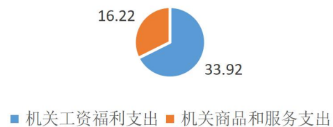
按政府支出经济分类

商品和服务支出（302）16.22 万元，较上年减少 1.48 万元，原因是政府确定压缩一般性支出。