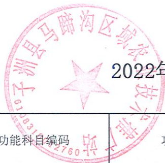
2022年部门综合预算一般公共预算基本支出明细表（按功能科目分）