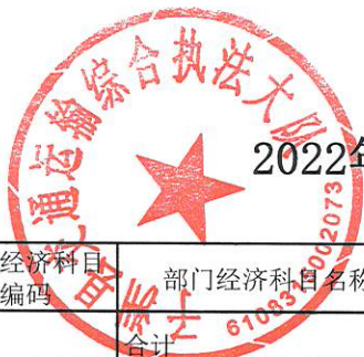
2022年部门综合预算一般公共预算支出明细表（按经济分类科目分）