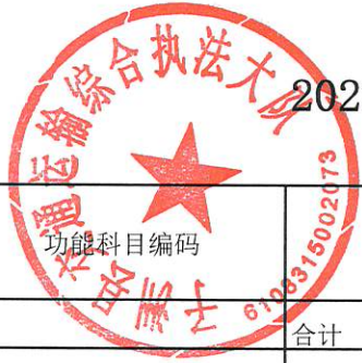
2022年部门综合预算一般公共预算基本支出明细表（按功能科目分）