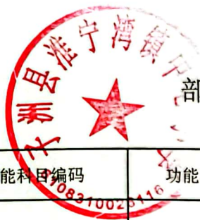
部门综合预算一般公共预算基本支出明细表（按支出功能分类科目）