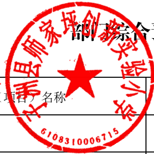
综合预算专项业务经费支出表