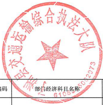
单位综合预算一般公共预算支出明细表（按支出经济分类科目）