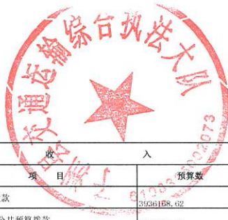
单位综合预算财政拨款收支总表