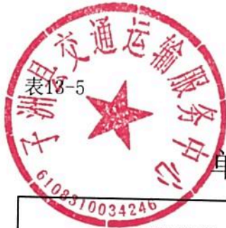
单位预算专项业务经费绩效目标表