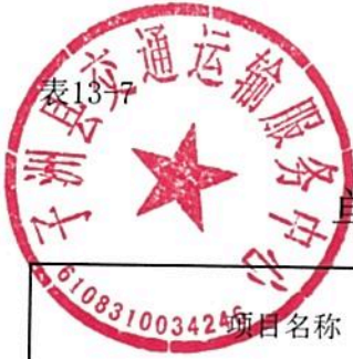
单位预算专项业务经费绩效目标表