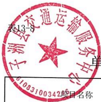
表13-8 单位预算专项业务经费绩效目标表