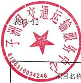
单位预算专项业务经费绩效目标表