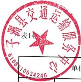
单位整体支出绩效目标表