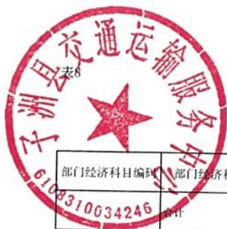
单位综合预算一般公共预算基本支出明细表（支出经济分类科目）