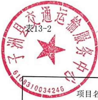
单位预算专项业务经费绩效目标表