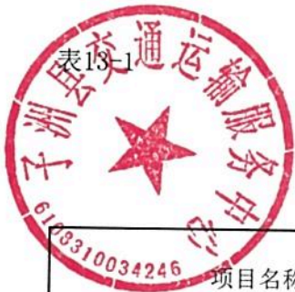
单位预算专项业务经费绩效目标表