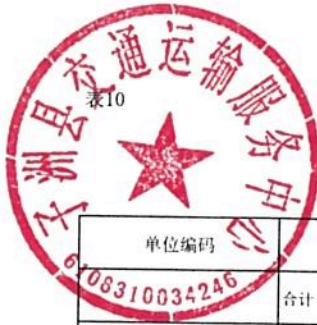
单位综合预算专项业务经费支出表