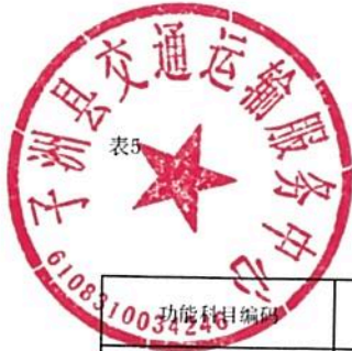
单位综合预算一般公共预算支出明细表（按支出功能分类科目）