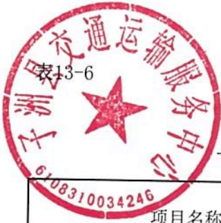
单位预算专项业务经费绩效目标表