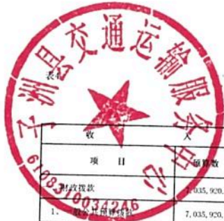
单位综合预算财政拨款收支总表