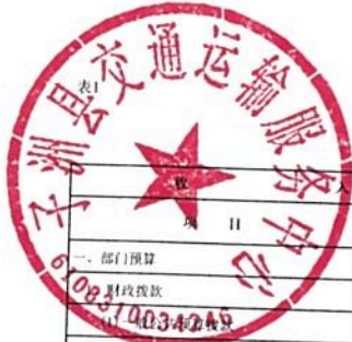
单位综合预算收支总表