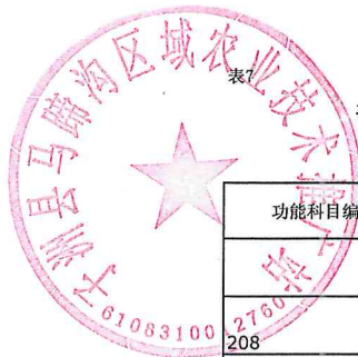
部门综合预算一般公共预算基本支出明细表（按支出功能分类科目）