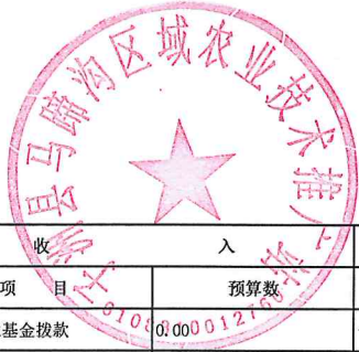
部门综合预算政府性基金收支表