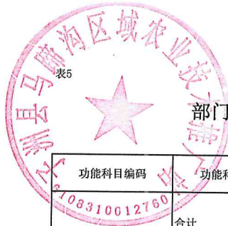
部门综合预算一般公共预算支出明细表（按支出功能分类科目）