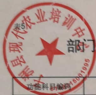
部门综合预算一般公共预算支出明细表（按支出功能分类科目）